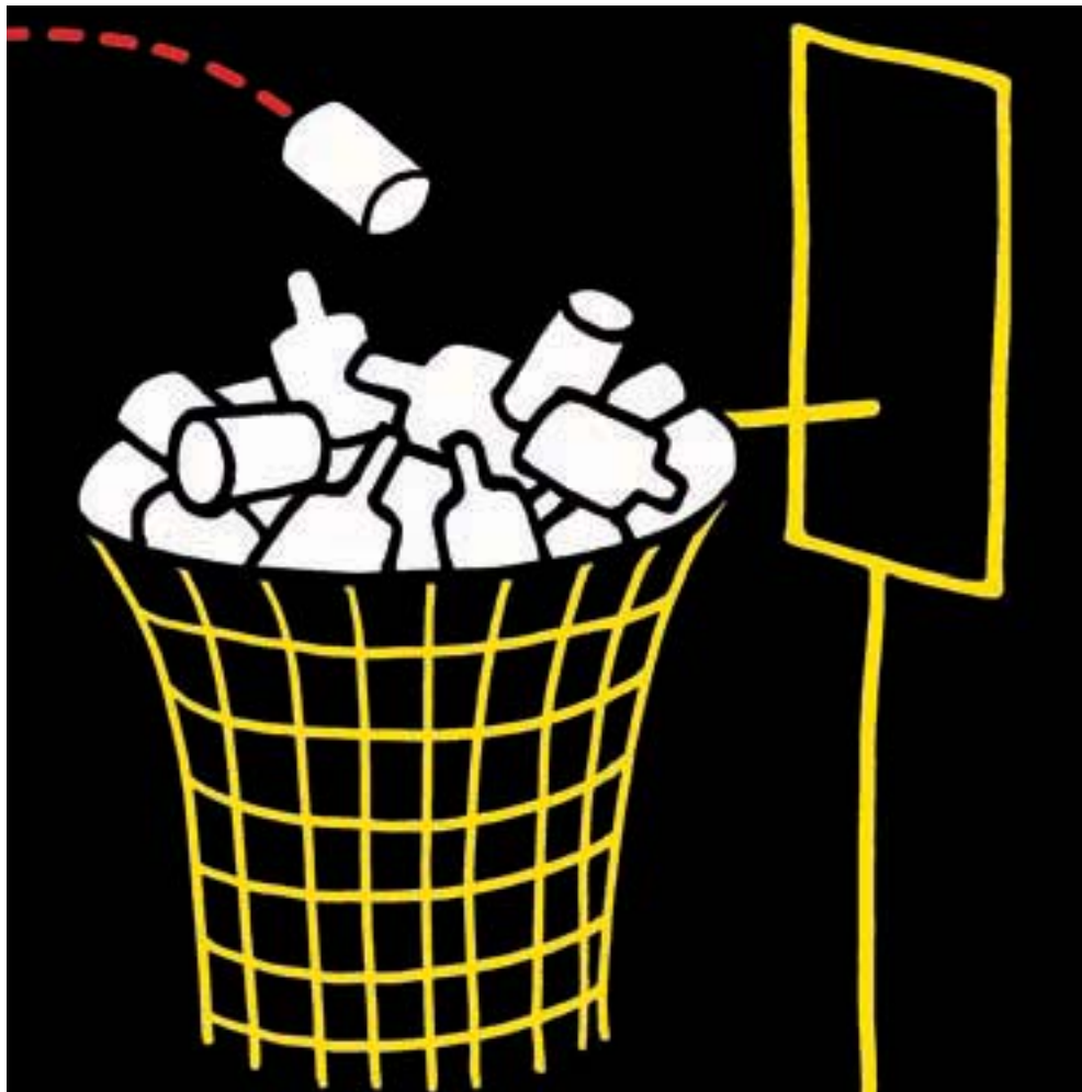
▲ Dessin de Kopelnitsky, Etats-Unis.

M. Szaky, 27 ans, a créé cette société en 2001 pour commercialiser [dans des bouteilles de soda usagées] un engrais biologique obtenu par lombricompostage. La firme s'est ensuite lancée dans la transformation de tonneaux à vin en composteurs domestiques et de disques vinyle en horloges. Des entreprises désireuses de verdir leur image lui ont aussi demandé de