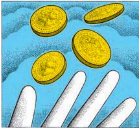
▲ Dessin de Clifford Harper paru dans The Guardian , Londres.

Un exemple qui date de 1934 : le wir est une monnaie complémentaire suisse fondée par 16 entrepreneurs pour permettre aux entreprises membres de se faire crédit. L'entreprise qui vend reçoit un crédit en wirs, et l'acheteur le débit