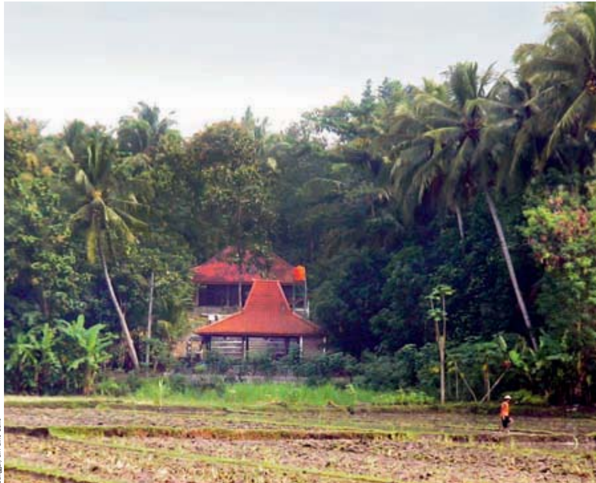
Sanggar/Giri Gino Guno