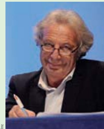
DOMINIQUE MARANINCHI, président de l'Institut national du cancer (INCa)

FUTURING PRESS Dans les domaines de la santé et de la science, quelles sont pour vous les grandes mutations dans lesquelles les sociétés sont engagées ?